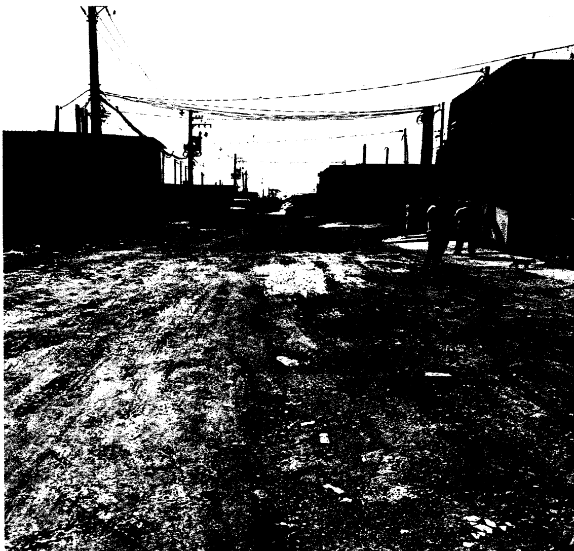
IMPLANTAÇÃO DE ILUMINAÇÃO PÚBLICA COM INSTALAÇÃO DE BRAÇOS E LUMINÁRIAS NO POSTE EM TODA A EXTENSÃO DA RUA EUROPA, JARDIM SANTOS DUMONT II- MOGI DAS CRUZES.